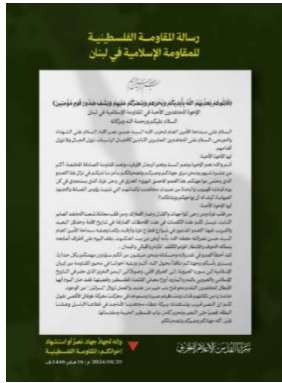
האיגרת לחזבאללה (ערוך הטלגרם של זרוע ההסברה הקרבית של פלוגות ירושלים, 20 באוגוסט 2024)