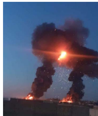
מימין: הפיצוצים בעקבות התקיפות במרחב חמא (חשבון X של Mohamed619, 23 באוגוסט 2024); משמאל: תקיפה במרחב חמץ (צאברין ניוז, 23 באוגוסט 2024)