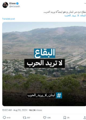
הציוץ של הזמרת אליסה (חשבון X של elissakh, 20 באוגוסט 2024)

◀ בעקבות תקיפות חיל האוויר נגד מחסני אמל"ח של חזבאללה בבקעת הלבנון, פרסמה הזמרת הלבנונית הבינלאומית אליסה בחשבון X שלה (15.6 מיליון עוקבים) כי "הבקעה היא חלק מלבנון וגם היא לא רוצה מלחמה". היא צירפה תמונה מבקעת הלבנון ואת התגית "לבנון לא רוצה מלחמה". תומכי חזבאללה הגיבו בכעס וקראו לה לא להתערב, אולם רבות מהתגובות הביעו תמיכה בעמדתה של הזמרת והצטרפו לקריאה נגד המלחמה (חשבון X של elissakh, 20 באוגוסט 2024).