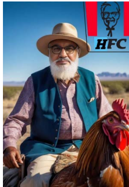
נצראללה בדמות בוקר אמריקני, רוכב על תרנגול (חשבון X של מחמד אלרוקי, 25 באוגוסט 2024)

◆ מחמד אלרוקי, סעודי המתנגד לאיראן ולחות'ים, פרסם בחשבון X שלו (8,243 עוקבים) כרזה לגלגנית, שנוצרה ככל הנראה באמצעות בינה מלאכותית, בה נראה מזכ"ל חזבאללה, חסן נצראללה, בלבוש של בוקר אמריקאי, רוכב על תרנגול וברקע נראית הדמות המזוהה עם הלוגו של KFC (Kentucky Fried Chicken), שהוחלף ל-HFC [ה-H אמורה לייצג את Hezbollah] (חשבון X של מחמד אלרוקי, 25 באוגוסט 2024).