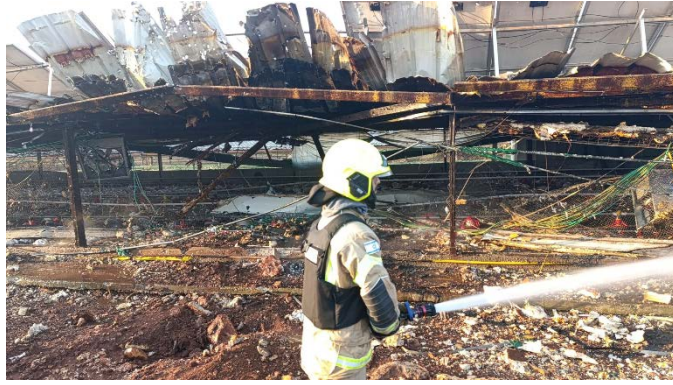
הנזק בלול התרנגולות ביישוב מנות (דוברות כבאות והצלה, 25 באוגוסט 2024)

לפי צה"ל, במסגרת התקיפה של חזבאללה זוהו 230 שיגורים ו-20 כטב"מים שחצו לשטח ישראל. 90% מהשיגורים שוגרו מלב אוכלוסייה אזרחית ומסמוך לתשתיות אזרחיות כמו בתי ספר, מסגדים ואתרים של האו"ם (דובר צה"ל ותקשורת ישראלית, 26 באוגוסט 2024).