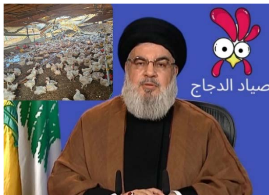
נצראללה והאיור "צייד התרנגולות" (חשבון X של Noura, 25 באוגוסט 2024)

◆ פעילת הרשת הסעודית נורה פרסמה בחשבון X שלה (כ-16.9 אלף עוקבים) כרזה לגלגנית, בה נראה מזכ"ל חזבאללה, חסן נצראללה, ומאחוריו איור של תרנגול עם הכיתוב "צייד התרנגולות" וצילום של הלול שנפגע. היא כתבה בלגלוג: "חזבאללה: לאחר התגובה נגד הצבא הישראלי, שתקף את דרום לבנון, תגובתנו נגד ישראל הסתיימה. ואם תחזור [על כך], אנו נחזור [על כך]". והתגובה של חזבאללה היתה נגד לול תרנגולות (חשבון X של Noura, 25 באוגוסט 2024).