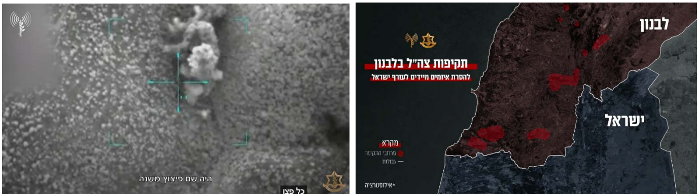
מימין: אילוסטרציה של האתרים שהותקפו בלבנון. משמאל: תיעוד אחת התקיפות (דובר צה"ל, 25 באוגוסט 2024)

ב-25 באוגוסט 2024, לפנות בוקר, תקפו כמאה מטוסים של חיל האוויר יותר מ-270 מטרות של חזבאללה בדרום לבנון, בהם אלפי משגרי רקטות. נמסר כי המשגרים כוונו בעיקר לצפון ישראל, וחלקם נועדו לשיגור רקטות לעבר מרכז הארץ, לאזור מפקדות אסטרטגיות בגלילות. דובר צה"ל ציין כי התקיפה נועדה לסכל תקיפה נרחבת של חזבאללה (דובר צה"ל ותקשורת ישראלית, 25 באוגוסט 2024).