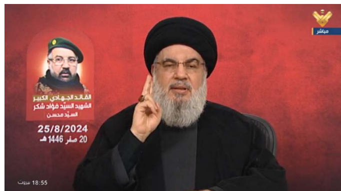
נצראללה בנאום על התקיפה נגד ישראל (אלמנאר, 25 באוגוסט 2024)

◆ השפעת התקיפה על ישראל: הוא שיבח את הפעולה וציין כי מדובר במבצע הגדול הראשון ש"ההתנגדות" מבצעת בהיעדרו של פואד שכר וכי היא בוצעה ללא רבב. הוא תהה אם "ישראל השביתה את תל אביב ואת שדות התעופה ופתחה מקלטים רק בגלל שהשתמשו ברקטות וכטב"מים, מה יקרה אם נשתמש ביותר מזה?".