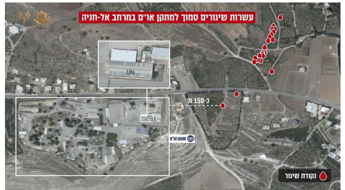
אתרי שיגור של חזבאללה ליד אתרים אזרחיים בדרום לבנון (דובר צה"ל, 26 באוגוסט 2024)