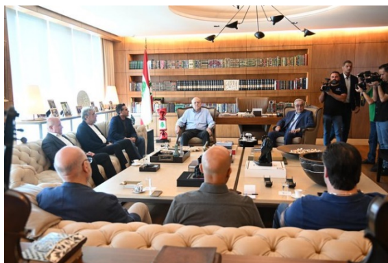
ישיבת החירום של ממשלת לבנון (חשבון X של לשכת ראש ממשלת לבנון, 25 באוגוסט 2024)

ראש ממשלת המעבר בלבנון, נג'יב מיקאטי, כינס ישיבת שרים דחופה כדי לדון בהתפתחויות ובמוכנות של שירותי החירום במדינה. בישיבה השתתפו שרי החוץ, המשפטים, הבריאות, הסביבה, הכלכלה, התחבורה והאנרגיה, נשיא מועצת דרום לבנון ומזכ"ל המועצה העליונה לביטחון. במהלך הישיבה, הדגיש מיקאטי כי הוא נמצא בקשר עם שותפיה של לבנון כדי לעצור את ההסלמה. הוא הבהיר כי יש לעצור את "התוקפנות" הישראלית וליישם את החלטה 1701. כמו כן, הוא ציין כי לבנון תומכת במאמצים הבינלאומיים להשגת הפסקת אש ברצועת עזה (חשבון X של ראש ממשלת לבנון, 25 באוגוסט 2024).