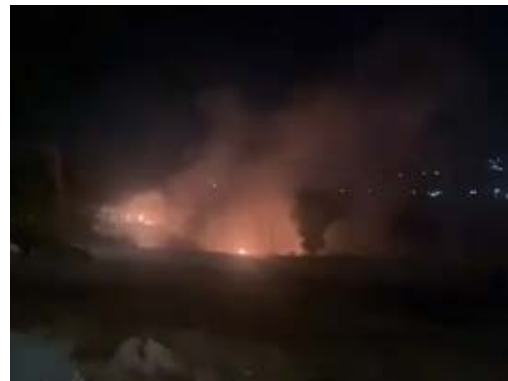
מימין: זירת הפגיעה במשאית בבקעת הלבנון (אלנהאר, 28 באוגוסט 2024). משמאל: תקיפת מבנה באלעדיסה (דובר צה"ל, 27 באוגוסט 2024)