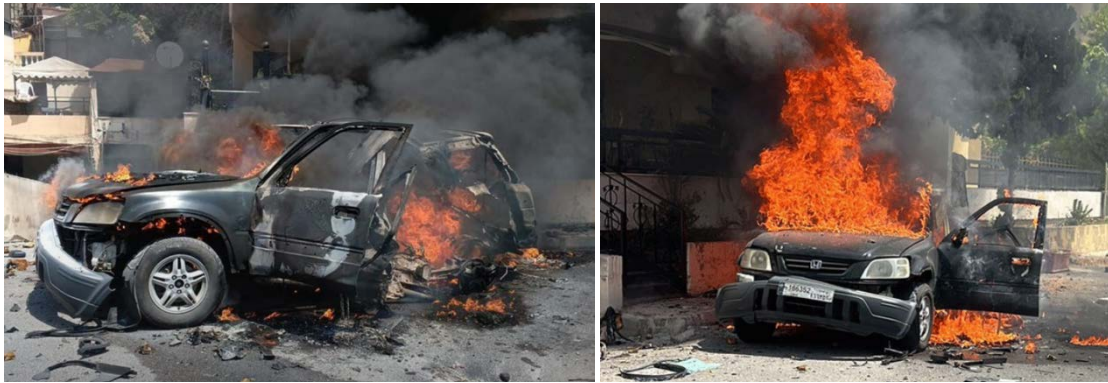
מכוניתו של חליחל עולה באש בקרבת צידון (מימין: אלעהד, 26 באוגוסט 2024. משמאל: אלנהאר, 26 באוגוסט 2024)

◀ ב-26 באוגוסט 2024, דווח שכטב"ם ישראלי שיגר שני טילים לעבר מכונית שחנתה בין העיירות עברא ושכונת צידא בקרבת הכביש המהיר אלשמאע בקרבת צידון. צוין כי יעד התקיפה היה בכיר בחמאס, נצ'אל חליחל, המכונה אבו עמר, שנפגע בעת שיצא מביתו לכיוון מכוניתו, וכי הוא נפצע קשה ברגליו (אלנהאר; אלעהד, 26 באוגוסט 2024). "מקור ביטחוני לבנוני" מסר כי חליחל נפצע באורח קל (אלג'זירה, 26 באוגוסט 2024).