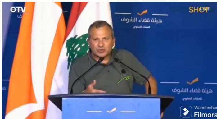
ג'בראן באסיל