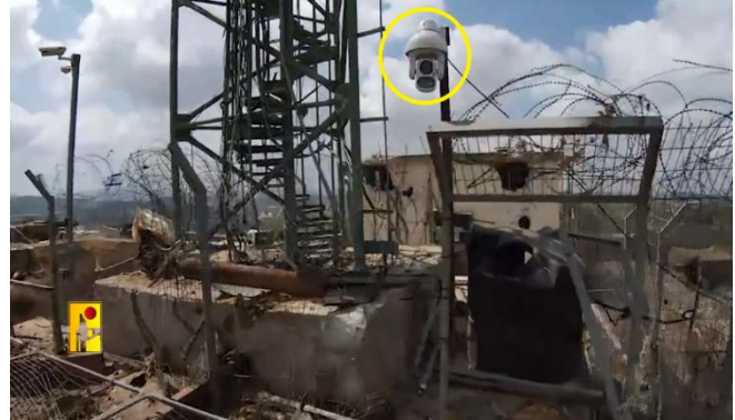
תקיפות באמצעות רחפני נפץ נגד מצלמות תצפית במוצבי צה"ל (מימין): ערוץ הטלגרם של זרוע ההסברה הקרבית של חזבאללה, 28 באוגוסט 2024; משמאל: ערוץ הטלגרם של זרוע ההסברה הקרבית של חזבאללה, 29 באוגוסט 2024)

◀ להלן פירוט התקיפות (ערוץ הטלגרם של זרוע ההסברה הקרבית של חזבאללה, 26 באוגוסט – 2 בספטמבר 2024, עד השעה 13:00):