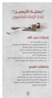
כרזה לגבי "פעולת הארבעין" (סימיא, 26 באוגוסט 2024)

◆ תיק הרשתות החברתיות של חזבאללה, סימיא, פרסם כרזה בשם "פעולת הארבעין". בכרזה נטען כי הארגון הגיב באופן "מדוד וקשוח" ולא גרר את האזור למלחמה נרחבת. בין ההישגים שהארגון מנה: קיבוע משוואת "תל אביב שוות ערך לאלצ'אחיה"; חשיפת היקף החדירות של המודיעין הישראלי; הגעה לעומק של 110 ק"מ בתוך ישראל; הצלחה בפגיעה במטרות וכן עקיפת כיפת ברזל ומערכת חץ; הגנה על העמדות של כל הכטב"מים מפני תקיפות האויב. בין "כישלונות האויב" שצוינו בכרזה: כישלון חדש למודיעין הישראלי; פעולתו היזומה לא הצליחה לסכל את התגובה; חזבאללה טען כי הממשל הישראלי המציא נרטיב שקרי חדש שאפילו לא שכנע את הציבור הישראלי; מערכות ההגנה שלו נכשלו ביירוט הרקטות והכטב"מים; לטענת הארגון, ישראל ביצעה ארבעים תקיפות שפגעו רק במספר כני שיגור (סימיא, 26 באוגוסט 2024).