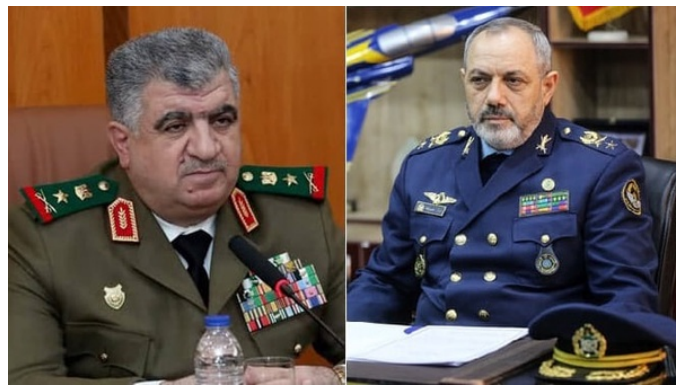
שרי ההגנה של איראן (מימין) וסוריה (פארס, 1 בספטמבר 2024)

• שר ההגנה האיראני, עזיז נצירזאדה, שוחח עם שר ההגנה הסורי, עלי מחמוד עבאס, והדגיש את תמיכת איראן בביטחונה ובלכידותה הטריטוריאלית של סוריה. הוא קרא למימוש ההסכמים שנחתמו בין שתי המדינות, ולהרחבת שיתוף הפעולה ביניהן, שלדבריו יוביל לתבוסת "המשטר הציוני". שר ההגנה הסורי הדגיש את הצורך בהמשך שיתוף הפעולה בין איראן, סוריה ו"ציר ההתנגדות" נגד ישראל (פארס, 1 בספטמבר 2024).