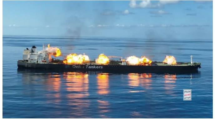
תמונות מהסרטון שתיעד לכאורה את הפשיטה ופיצוץ המטענים על סיפון מכלית הנפט Sounion (חשבון X של זרוע המדיה של הכוחות המזוינים החות'ים, 29 באוגוסט 2024).