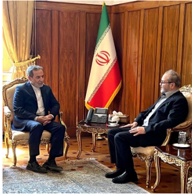
פגישת שר החוץ האיראני עם נציג חזבאללה בטהראן (אתר משרד החוץ האיראני, 1 בספטמבר 2024)