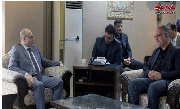
פגישת ראש עיריית טהראן עם שר הכלכלה הסורי (סאנ"א, 4 בספטמבר 2024)

• ב-5 בספטמבר 2024, חתמו טהראן ודמשק על הסכם ערים תאומות ביניהן. ההסכם, שנחתם במעמד ראש עיריית טהראן ומושל מחוז דמשק, מתייחס לשיתוף פעולה בין הערים בתחומים מגוונים, בהם תחבורה, מיחזור פסולת עירונית, אוטומציה ומערכות אלקטרוניות (אלוטן, 5 בספטמבר 2024). ראש עיריית טהראן, עלי-רצ'א זאכאני, נועד במהלך ביקורו בדמשק עם שר הכלכלה הסורי, מחמד סאמר אלח'ליל, ודן עימו בשיפור שיתוף הפעולה הכלכלי והמסחרי בין הצדדים (סאנ"א, 4 בספטמבר 2024).