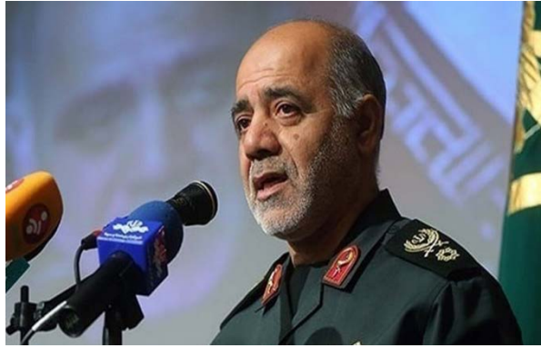
סגן הרמטכ"ל האיראני (פארס, 4 בספטמבר 2024)