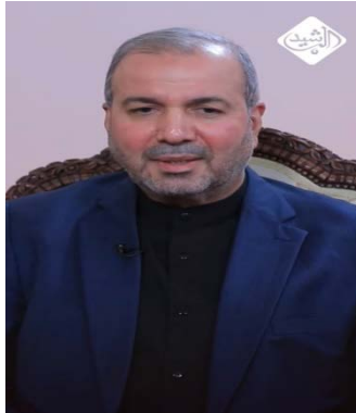
שגריר איראן בעיראק בריאיון לערוץ אלרשיד (7 בספטמבר 2024)

המפקדים האיראניים, ותהיה שונה מהתגובה האיראנית הקודמת לפסקה עלהבאפריל 2024 (ערוץ אלרשיד, 7 בספטמבר 2024).