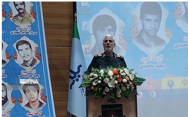
סגן נציג המנהיג במשמרות המהפכה (מהר, 3 בספטמבר 2024)