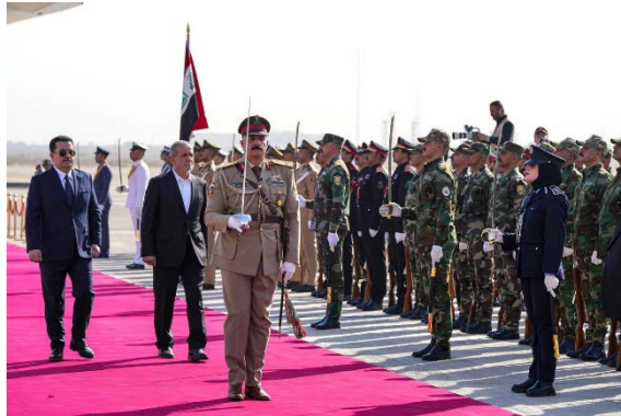
פ'זשכיאן מתקבל על ידי ראש ממשלת עיראק עם הגעתו (ערוץ אלעאלם, 11 בספטמבר 2024)

להיפגש עם בכירי הממשל העיראקי ולחתום על הסכמים לשיתוף פעולה בין שתי המדינות (איסנ"א, 11 בספטמבר 2024).