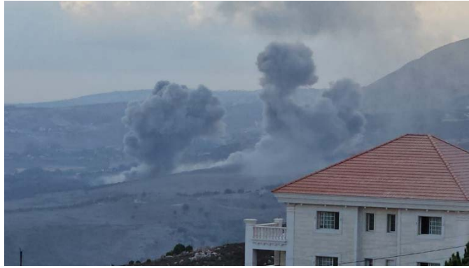
תקיפות חיל האוויר באלמחמודיה בדרום לבנון (חשבון X של לבנון און-ניוז, 15 בספטמבר 2024)