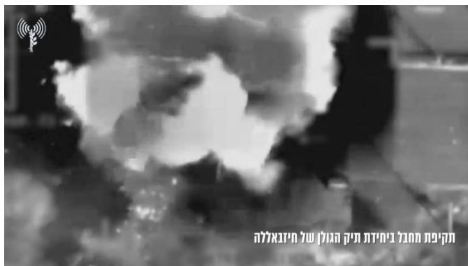
תקיפת אחמד אלג'בר בסוריה (דובר צה"ל, 12 בספטמבר 2024)

בהם "דמות צבאית" שמשתייכת לחזבאללה או להתנגדות האסלאמית לשחרור הגולן (מרכז המעקב הסורי, 12 בספטמבר 2024).