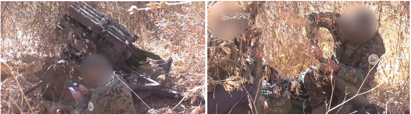
מימין: פעילי גדודי עז אלדין בלבנון מחברים מרעומים לרקטות, טרם שיגורן לעבר מפקדת חטיבה 300; משמאל: היערכות לשיגור הרקטות (ערוץ הטלגרם של גדודי עז אלדין אלקסאם, 14 בספטמבר 2024)

◀ כוחות אלפג'ר, הזרוע הצבאית של אלג'מאעה אלאסלאמיה, קיבלו אחריות על שיגור מטח רקטות לכיוון "מוצב בית הלל" שבקריית שמונה, וזאת "בתגובה למעשי הטבח נגד תושבי לבנון ופולסטין וכתמיכה בתושבי עזה והגדה המערבית". בהודעה נטען כי הושגו פגיעות ישירות (אלג'מאעה אלאסלאמיה, 9 בספטמבר 2024) ◀ ב-11 בספטמבר 2024, קיבלו גדודי עז אלדין אלקסאם, הזרוע הצבאית של חמאס, אחריות על שיגור מטח של שלושים רקטות לעבר מפקדת החטיבה המערבית 300 בגליל המערבי. בסרטון שפרסם הארגון, נראה שיגור של רקטות קצרות בקוטר 107 מ"מ ממשגר נגרר בעל 12 קנים (ערוץ הטלגרם של גדודי עז אלדין אלקסאם, 11 ו-14 בספטמבר 2024).