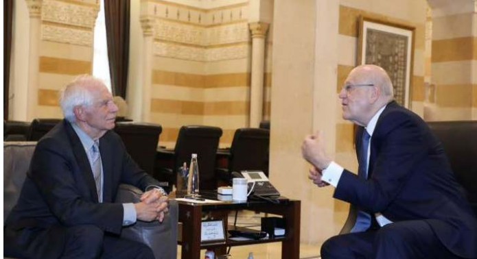
פגישת מיקאטי ובורל (אלנשרה, 12 בספטמבר 2024)

◆ בפגישה עם ראש ממשלת המעבר בלבנון, נג'יב מיקאטי קרא מיקאטי להגביר את הלחץ הבינלאומי על ישראל כדי לגרום לה לעצור את "התוקפנות המתמשכת" נגד לבנון (אלנשרה, 11 בספטמבר 2024).