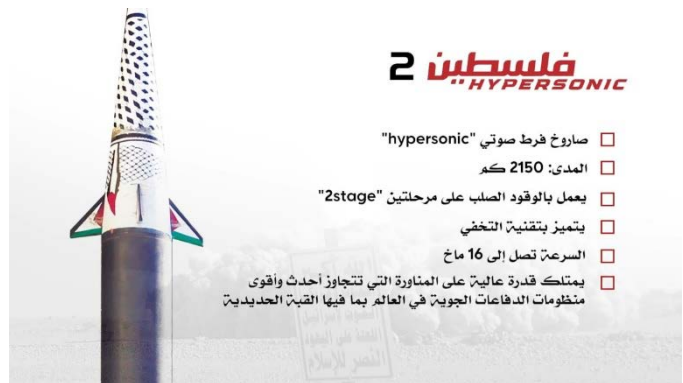
משמאל: שיגור הטיל 'פלסטין 2' לעבר ישראל. מימין: המאפיינים הטכניים של הטיל (ערוץ הטלגרם של זרוע המדינה של הכוחות החות'ים, 16 בספטמבר 2024)

בכירים בהנהגה החות'ים הגיבו על שיגור הטיל. להלן התבטאויות בולטות: