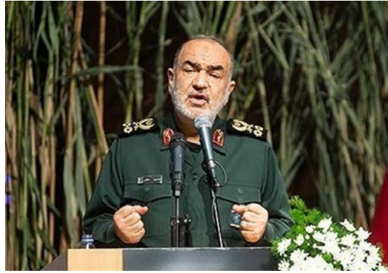
מפקד משמרות המהפכה (תסנים, 13 בספטמבר 2024)

בשיחה עם עיתונאים, נשאל סלאמי בנוגע לתגובת איראן על הריגת אסמאעיל הניה בטהראן, ואמר כי היא ודאית, תבוא במועדה וכי לא ניתן לדבר על פרטיה (תסנים, 14 בספטמבר 2024).