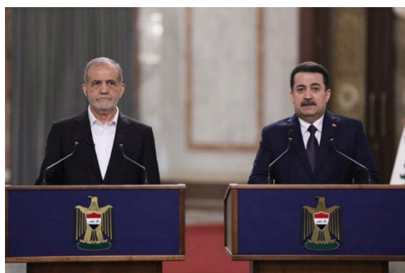
נשיא איראן וראש ממשלת עיראק (איסנ"א, 11 בספטמבר 2024)

במסיבת עיתונאים משותפת עם ראש ממשלת עיראק, הדגיש פ'זשכיאן את חשיבות הרחבת היחסים בין שתי המדינות. לדבריו, מימוש ההסכם הביטחוני בין שתי המדינות חיוני כדי להיאבק בטרוריסטים ובאויבים המסכנים את היציבות והביטחון באזור. הוא ציין כי באמצעות אחדות בין המדינות האסלאמיות, יהיה ניתן למנוע את המשך "פשעי המשטר הציוני" (מהר, 11 בספטמבר).