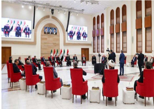
מפגש של נשיא איראן עם מנהיגי המפלגות השיעיות בעיראק (איסנ"א, 11 בספטמבר 2024)

• כמו כן, נועד פ'זשכיאן עם מנהיגי המפלגות השיעיות הפרו-איראניות בעיראק בנוכחות ראש ממשלת עיראק ויו"ר סיעת "החוכמה הלאומית", סיד עמאר אלחכים. הנשיא אמר במפגש כי אם תהיה אחדות בין המדינות האסלאמיות, ארה"ב, אירופה וישראל לא יעזו להפציץ את המוסלמים בקלות רבה כל כך ואז לטעון שהן מגנות על זכויות האדם ועל הדמוקרטיה (איסנ"א, 11 בספטמבר 2024).