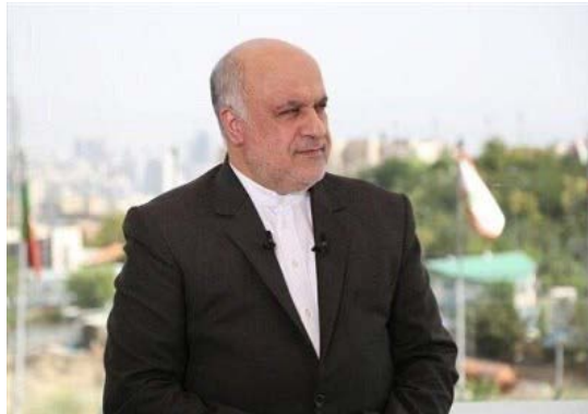
שגריר איראן בבירות (תסנים, 17 בספטמבר 2024)

• שגריר איראן בלבנון, מג'תבא אמאני, נפצע באירוע פיצוצי מכשירי הקשר של פעילי חזבאללה בלבנון ב-17 בספטמבר 2024. שגרירות איראן בבירות מסרה כי הוא נפצע באופן שטחי וכי מצבו הכללי טוב (חשבון X של שגרירות איראן בבירות, 17 בספטמבר 2024). לפי דיווח נוסף, השגריר נפצע כתוצאה מפיצוץ מכשיר קשר של אחד ממלווי (תסנים, 17 בספטמבר 2024). לעומת זאת, "מקורות" בטהראן מסרו כי השגריר ספג פציעות קשות, במיוחד בעינו (אלמיאדין, 18 בספטמבר 2024), אולם השגרירות האיראנית הכחישה את "השמועות" על מצבו הפיזי ומצב ראייתו של אמאני (חשבון X של שגרירות איראן בבירות, 18 בספטמבר 2024).