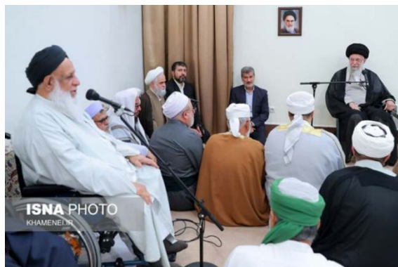
מנהיג איראן במפגש עם אנשי דת סוניים (איסנ"א, 16 בספטמבר 2024)

• מנהיג איראן, עלי ח'אמנהאי, אמר במפגש עם אנשי דת סוניים לרגל "שבוע האחדות המוסלמית" כי התמיכה "במדוכאים של עזה ופלסטין" היא אחת החובות החד-משמעיות. הוא ציין כי מי שאינו מצייט לחובה זו, יידרש לכך בידי האל (איסנ"א, 16 בספטמבר 2024).