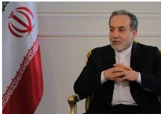
שר החוץ האיראני, עבאס עראקצ'י (15 בספטמבר 2024)

• שר החוץ האיראני, עבאס עראקצ'י, אמר כי מדיניות איראן היא תמיכה בלתי מוגבלת ב"התנגדות". הוא ציין כי "המשטר הציוני" לא הצליח עד כה להשיג את מטרתו העיקרית – השמדת חמאס. הוא הוסיף כי איראן הצליחה לנטרל בחוכמה את המלכודות שהיו עלולות לגרור אותה למלחמה (הטלוויזיה האיראנית, 15 בספטמבר 2024).