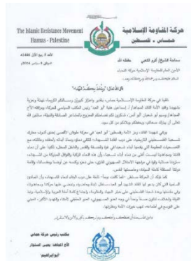
המכתב מאלסנואר לאלכעבי (ערוץ הטלגרם נון, 12 בספטמבר 2024)

על מותו של אסמאעיל הניה וציין כי חמאס תמשיך להילחם "בעוצמה" נגד ישראל עד סילוקה. אלסנואר גם הדגיש את הצורך בשמירה על אחדות העם הפלסטיני "בדרך הג'האד וההתנגדות" ועל אחדות האומה הערבית והאסלאמית (ערוץ הטלגרם נון, 12 בספטמבר 2024).