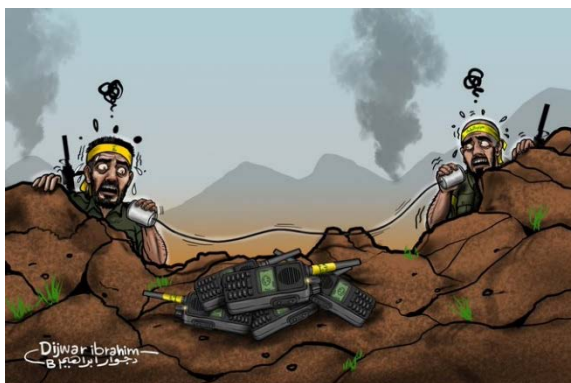
קריקטורה של דג'ואר אברהים הכורדי (חשבון X של דג'ואר אברהים, 17 בספטמבר 2024)