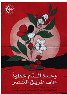
איור תמיכה בלבנון: "אחדות הדם היא צעד בדרך לנצחון; יחי המאבק הלבנוני-הפלסטיני המשותף מול הטרור הציוני" (ערוץ הטלגרם של מחלקת ההסברה המרכזית של חז"ע, 17 בספטמבר 2024)

◆ בהודעת החזית העממית לשחרור פלסטין (חז"ע) נכתב כי הפיצוצים הנרחבים בלבנון מהווים "הסלמה ציונית מסוכנת", שמתבצעת בתיאום ודאי עם ארה"ב וכוחות מערביים. עוד נמסר בהודעה כי האירועים מאשרים את כוונת ישראל להפעיל לחץ על לבנון ולבצע פעולות רחבות שייצרו מציאות חדשה המשרתת את האינטרסים הביטחוניים והצבאיים שלה כמימוש להחלטת הקבינט "הציוני". בחז"ע גם הביעו ביטחון כי "ההתנגדות" מסוגלת להכיל את התקיפה ולהגיב בחוזקה וכי היא תמשיך בתמיכתה ברצועת עזה (ערוץ הטלגרם של מחלקת ההסברה המרכזית של חז"ע, 17 בספטמבר 2024).