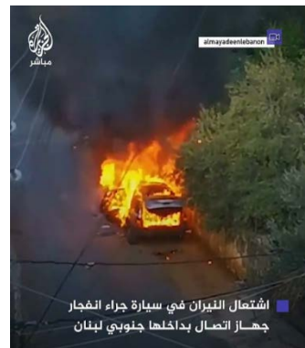
מימין: מכונית עולה באש באלנבטיה, לאחר שהתפוצץ בה מכשיר קשר (אלג'זירה, 18 בספטמבר 2024). משמאל: פצוע שרוע על הכביש בצ'אחיה אלג'נוביה במהלך הלוויה, לאחר פיצוץ מכשיר קשר שנשא (אלג'דיד, 18 בספטמבר 2024)