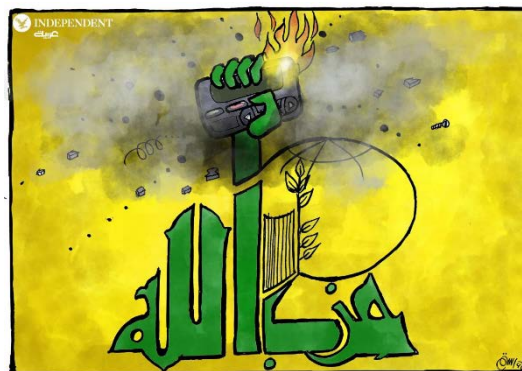
מימין: סמל חזבאללה עם זימונית עולה באש (אינדיפנדנט בערבית, 18 בספטמבר 2024). משמאל: סוס טרויאני בדמות מכשיר קשר (אלשרק אלאוסט, 18 בספטמבר 2024)