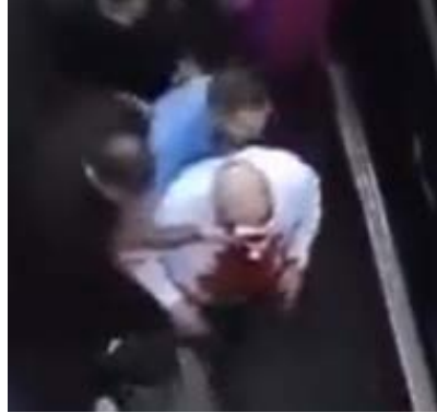
אמאני מובל פצוע לבית חולים (חשבון X של ריאן אלמצרי, 17 בספטמבר 2024)

"מקורות" בטהראן מסרו כי השגריר ספג פציעות קשות, במיוחד בעיניו (אלמיאדין, 18 בספטמבר 2024), אולם השגרירות האיראנית הכחישה את "השמועות" על מצבו הפיזי ומצב ראייתו של אמאני (חשבון X של שגרירות איראן בבירות, 18 בספטמבר 2024). הסהר האדום האיראני העביר את אמאני לטיפול באיראן, יחד עם יותר-90 פצועים נוספים מהפיצוצים (SNN, 19 בספטמבר 2024).