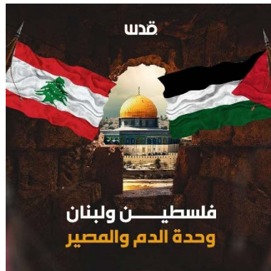
כרוז שפורסם בסוכנות קדס, המזוהה עם חמאס, תחת הכיתוב "פלסטין ולבנון - דם וגורל אחד" (ערוץ הטלגרם אח'באר ג'נין, 17 בספטמבר 2024)

◆ חמאס האשימה את ישראל בביצוע "פשע", וציינה שהוא חלק ממדיניות "התוקפנות" הישראלית הנתמכת על ידי ארה"ב. חמאס הביעה סולידריות עם חיזבאללה והעם הלבנוני, ושיבחה את מאבקם ותמיכתם ברצועה עזה. בנוסף, היא הדגישה כי "הפשעים הישראליים" לא ישברו את רוח "ההתנגדות" של העמים החופשיים (ערוץ הטלגרם של סוכנות שהאב, 17 בספטמבר 2024).