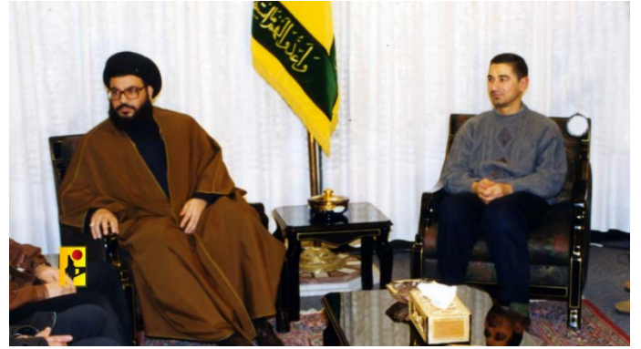
מימין: עקיל עם נצראללה (בתמונה ישנה); משמאל: עקיל עם האשם צפי אלדין