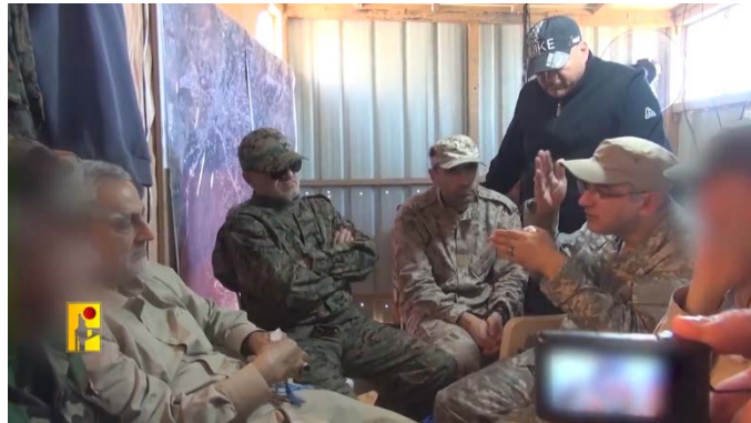
עקיל (מימין) עם מפקד כוח קדס הקודם, קאסם סלימאני (משמאל) ובכירים נוספים בחזבאללה