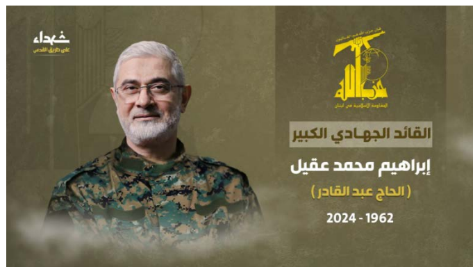
הודעת חזבאללה על מותו של אברהים עקיל (ערוץ הטלגרם של זרוע ההסברה הקרבית של חזבאללה, 20 בספטמבר 2024)

◀ בליל 20-21 בספטמבר 2024, פרסם חזבאללה את ההודעה הרשמית על מותו של אברהים עקיל, המכונה אלחאג' עבד אלקאדר. ההודעה כינתה אותו "המפקד הג'האדי הגדול", התואר הבכיר ביותר שניתן לאחד מהרוגי חזבאללה מאז תחילת העימות הנוכחי ב-8 באוקטובר 2023, 2 וציינה כי הוא "שהיד בדרך לירושלים", בדומה ליתר הרוגי חזבאללה בעימות. בהודעת הארגון צוין כי עקיל היה "אחד ממנהיגי הגדולים ביותר" וכי "ירושלים הייתה תמיד בליבו, במוחו ובמחשבתו יומם וליל" (ערוץ הטלגרם של זרוע ההסברה הקרבית של חזבאללה, 21 בספטמבר 2024). על פירוט פעילותו במסגרת חזבאללה, ראו נספח א'.