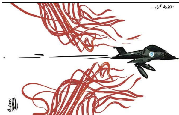
קריקטורה ביומן הפלסטיני אלקדס תחת הכותרת: הקווים האדומים (אלקדס, 21 בספטמבר 2024)

◀ החזית העממית לשחרור פלסטין האשימה כי התקיפה הייתה תוצאה של תכנון משותף בין ישראל לבין ארה"ב. בהודעה נאמר כי מדובר במדיניות הסלמה מכוונת שנועדה לפגוע בתשתיות, מתקנים אזרחיים ואזרחים חפים מפשע "במטרה כושלת לשבור את ההתנגדות". הארגון הדגיש כי "הפגיעה במפקדים לא תשבור את נחישות ההתנגדות, שעדיין מסוגלת לפצות על אבדותיה" (ערוץ הטלגרם של מחלקת ההסברה המרכזית של חז"ע, 21 בספטמבר 2024).