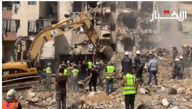
זירת התקיפה בצ'אחיה אלג'נוביה בבירות (אלאח'באר, 21 בספטמבר 2024)

ב-20 בספטמבר 2024, סמוך לשעה 16:00 אחר הצהריים, בוצעה תקיפה אווירית ישראלית בפרבר הדרומי (אלצ'אחיה אלג'נוביה) בבירות (אלמיאדין, 20 בספטמבר 2024). לפי העדכון האחרון של משרד הבריאות הלבנוני (22 בספטמבר 2024, נכון לשעה 16:00), נהרגו חמישים בני אדם כתוצאה מהתקיפה הישראלית באלצ'אחיה אלג'נוביה. המשרד הוסיף כי פעולות פינוי ההריסות מהאזור נמשכות (אלנשרה, 21 בספטמבר 2024).