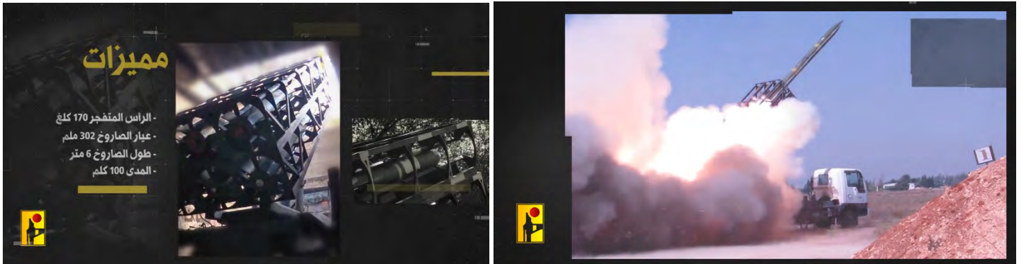
מימין: שיגור רקטה מדגם פאדי-2 של חזבאללה; משמאל: משגר רב-קני לרקטות מדגם פאדי-2 (ערוץ הטלגרם של זרוע ההסברה הקרבית של חזבאללה, 22 בספטמבר 2024)

◆ סיכול ניסיון פיגוע מטען בגבול לבנון-ישראל: ב-16 בספטמבר 2024 זיהו כוחות צה"ל חשודים שהתקרבו לאזור הגבול. כוחות ארטילריה וכלי טיס תקפו את האזור וכתוצאה מכך נהרגו שני פעילי טרור, שלפי צה"ל ניסו לבצע פיגוע מטען נגד מוצב צבאי. הפעילים החזיקו ברשותם מצלמות גוף, שתעדו את פעילותם וחלק מהתקיפה נגדם (דובר צה"ל, 19 בספטמבר 2024).