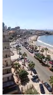
מימין: פקקים בכביש החוף ביציאה מצור (23 בספטמבר 2024). משמאל: פקקי תנועה בתוך צור (23 בספטמבר 2024)