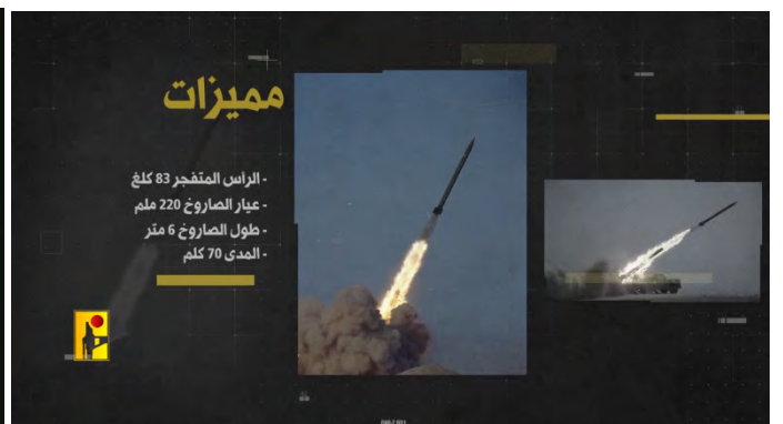
מימין: שיגור רקטות מדגם פאדי-1 של חזבאללה; משמאל: משגר רב-קני לרקטות מדגם פאדי-1