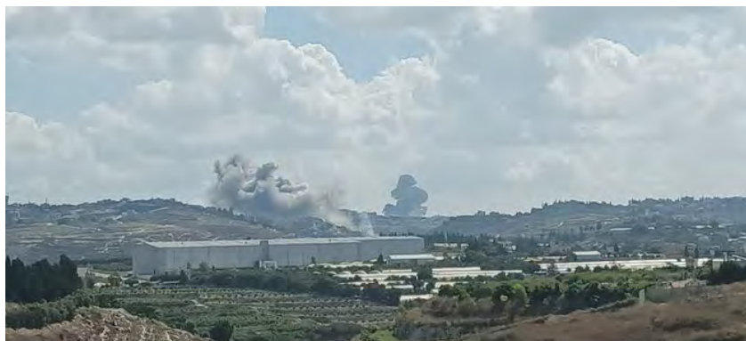
תקיפות חיל האוויר בדרום לבנון (אלאח'באר, 23 בספטמבר 2024)

בשבוע האחרון, בתגובה לפעילות חזבאללה ובפעילות מנע, תקפו כלי טיס של חיל האוויר יעדים ופעילים של חזבאללה בדרום לבנון ובבקעת הלבנון. בין היעדים שהותקפו: מאות משגרים עם אלפי קני שיגור שמרביתם היו מוכנים לשיגור מידי לשטח ישראל, חוליות חמושות, תשתיות טרור, מבנים צבאיים, מחסני אמצעי לחימה (אמל"ח) ועמדות (דובר צה"ל, 16-23 בספטמבר 2024). ב-23 בספטמבר 2024, דיווח צה"ל על תקיפות של יותר מ-300 מטרות של חזבאללה (דובר צה"ל, 23 בספטמבר 2024, נכון לשעה 12:30). משרד הבריאות הלבנוני דיווח על לפחות מאה הרוגים ויותר מ-400 פצועים בתקיפות (אלמיאדין, 23 בספטמבר 2024, נכון לשעה 14:00).