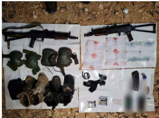
אמצעי הלחימה והציוד שאותרו ברשות החולייה (דובר צה"ל, 19 בספטמבר 2024)

◆ סיכול ניסיון פיגוע מטען בגבול לבנון-ישראל: ב-16 בספטמבר 2024 זיהו כוחות צה"ל חשודים שהתקרבו לאזור הגבול. כוחות ארטילריה וכלי טיס תקפו את האזור וכתוצאה מכך נהרגו שני פעילי טרור, שלפי צה"ל ניסו לבצע פיגוע מטען נגד מוצב צבאי. הפעילים החזיקו ברשותם מצלמות גוף, שתעדו את פעילותם וחלק מהתקיפה נגדם (דובר צה"ל, 19 בספטמבר 2024).