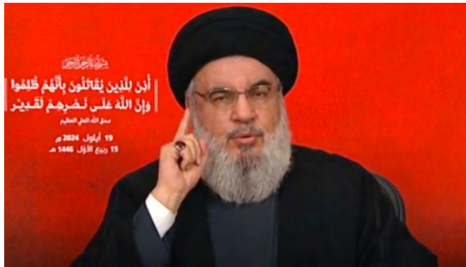
נצראללה בנאום (אלמנאר, 19 בספטמבר 2024)