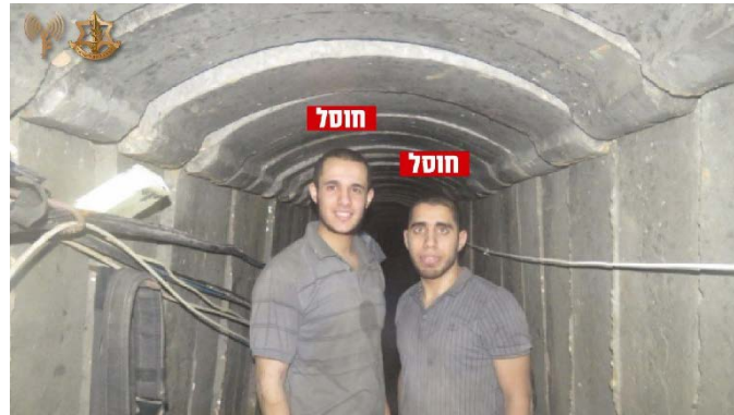
שני מחבלי חמאס בתוך המנהרה (דובר צה"ל, 21 בספטמבר 2024)

◀ ב-21 ספטמבר 2024, נמסר כי כוח צה"ל הרג שני פעילי חמאס שרצחו את ששת החטופים הישראליים שגופותיהם התגלו במנהרה ברפיח ב-31 באוגוסט 2024. לפי דובר צה"ל, השניים נהרגו בהיתקלות אחרי שיצאו מפיר תת קרקעי באזור תל אלסלטאן, יממה לאחר רצח החטופים, וברשותם התגלו ממצאים שקשרו אותם למנהרה שבה התגלו הגופות (דובר צה"ל, 21 בספטמבר 2024).