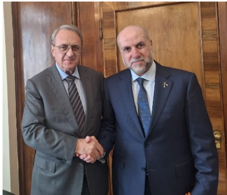
אלהבאש (מימין) עם בוגדנוב (דף הפייסבוק של מחמוד אלהבאש, 20 בספטמבר 2024)

ב-20 בספטמבר 2024, נפגש מחמוד אלהבאש, הקאצ'י הראשי של פלסטין ויועצו של אבו מאזן לענייני דת וקשרים אסלאמיים, במוסקבה עם סגן שר החוץ הרוסי, מיכאיל בוגדנוב, שמשמש השליח המיוחד של נשיא רוסיה למזרח התיכון. השניים דנו במאמצים לעצור את "התוקפנות" הישראלית ברצועת עזה, ביהודה ושומרון ובמזרח בירושלים, תוך הדגשת הצורך בהידוק הקשרים ושיתוף הפעולה בין רוסיה ל"פלסטין" (דף הפייסבוק של מחמוד אלהבאש, 20 בספטמבר 2024). בנאומו בפני הוועידה ה-20 של הפורום האסלאמי העולמי שהתקיימה ברוסיה, הדגיש אלהבאש כי העם הפלסטיני רוצה שלום, חותר אליו ומקריב למענו, וההוכחה לכך היתה כאשר אש"ף הסכים להקמתה של מדינה על חלק מ"המולדת ההיסטורית" (דף הפייסבוק של מחמוד אלהבאש, 21 בספטמבר 2024).