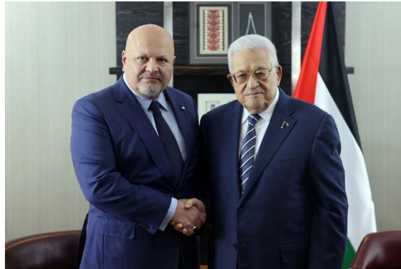
אבו מאזן עם כרים ח'אן (ופא, 23 בספטמבר 2024)

◆ בפגישה עם התובע הכללי של בית הדין הפלילי הבינלאומי (ICC) בהאג, כרים ח'אן, קרא אבו מאזן להאצת החקירות על "פשעי מלחמה" שבוצעו לכאורה על ידי ישראל במהלך "התוקפנות" נגד רצועת עזה ועל "טרור הקולוניאליסטים בגדה המערבית וההפרות נגד העצורים". הוא טען כי היעדר ענישה מעודדת את "המשך הפשעים" נגד הפלסטינים. כמו כן, אבו מאזן הדגיש כי על הקהילה הבינלאומית והארגונים המשפטיים של האו"ם לפעול כדי לחייב את ישראל ליישם את ההחלטות הרלוונטיות (ופא, 23 בספטמבר 2024).