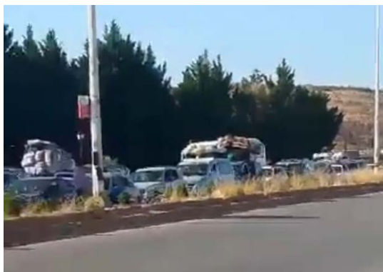
שיירות כלי רכב מלבנון בקרבת מעבר גבול לקראת כניסתם לסוריה (אלסוידא' 24, 25 בספטמבר 2024)

◀ "אחד המארגנים" במקלט עבור עקורים באקלים אלח'רוב שבהר הלבנון, דרומית לבירות, ציין כי חזבאללה מעורב בפעילות במרכזי העקורים, יחד עם מפלגות אחרות. לדבריו, אנשי חזבאללה מחלקים סיוע וחדרים, אולם גם מונעים גישה בלתי מורשית למרכזים (אלשרק אלאוסט, 26 בספטמבר 2024).