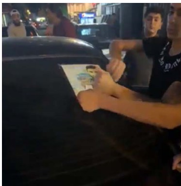
לבנונים-סונים מסירים מדבקה עם תמונה של איש חזבאללה מהשמשה האחורית של עקורים שיעים מדרום לבנון (רשת X, 25 בספטמבר 2024)

◆ ברשתות החברתיות פורסמו סרטונים שהראו תושבים סונים בטרפולי, העיר הגדולה בצפון לבנון, דורשים מעקורים שיעים מדרום לבנון ומאלצ'אחיה אלג'נוביה להסיר תמונות של חסן נצראללה ושל אנשי חזבאללה (חשבון X של קול לבנון, 25 בספטמבר 2024).