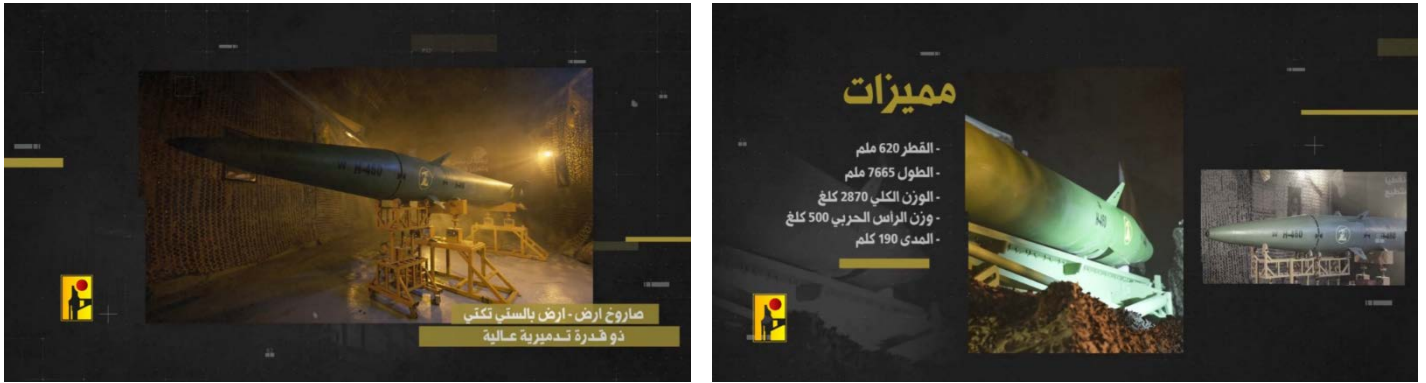
טיל קרקע-קרקע מדגם קאזר-1 של חזבאללה

◆ הכנסה לשימוש של רקטות חדשות: חזבאללה החל לתקוף באמצעות רקטות חדשות מדגם פאדי-3 . ב-24 בספטמבר 2024, בוצעה תקיפה נגד בסיס "שמשון", וב-25 בספטמבר 2024 שוגר מטח לעבר מפעל לחומרי נפץ באזור זיכרון יעקב. חזבאללה לא סיפק פרטים על הרקטה, אולם היא משתייכת לסדרה של רקטות פאדי-1 ופאדי-2 שבהן נעשה שימוש ראשון ב-22 בספטמבר 2024 (ערוץ הטלגרם של זרוע ההסברה הקרבית של חזבאללה, 24-25 בספטמבר 2024). 1