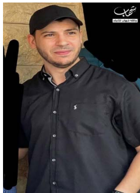
סעיד עטא אללה

◀ ב-5 באוקטובר 2024, נהרג פעיל הזרוע הצבאית של חמאס, סעיד עלאא נאיף עלי, בתקיפה של חיל האוויר בטרופולי שבצפון לבנון. נמסר כי הוא הוביל פיגועים נגד יעדים ישראליים ופעל לגייס פעילים לחמאס (דובר צה"ל, 5 באוקטובר 2024). הזרוע הצבאית של חמאס הודיעה על מותו של "המפקד" סעיד עטא אללה עלי, כתוצאה מתקיפה "ציונית" בביתו במחנה אלבדאוי שבמחוז טריפולי בצפון לבנון (ערוץ הטלגרם של הזרוע הצבאית של חמאס, 5 באוקטובר 2024).