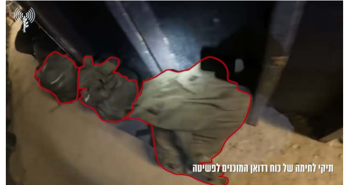
תיקי לחימה של כוח רדואן המוכנים לפשיטה

תיעוד מתשתיות תת-קרקע של כוח רדואן שנחשפה בדרום לבנון (דובר צה"ל, 5 באוקטובר 2024)