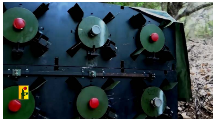
שש רקטות כבדות מסוג פאדי 4 של חזבאללה לקראת שיגורן לעבר "בסיס גלילות ומטה המוסד" (ערוץ הטלגרם של זרוע ההסברה הקרבית של חזבאללה, 3 באוקטובר 2024)