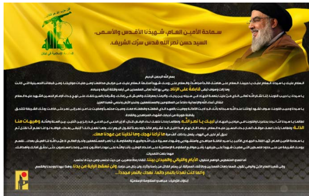
אגרת לוחמי חזבאללה לנצראללה (ערוץ הטלגרם של זרוע ההסברה הקרבית של חזבאללה, 1 באוקטובר 2024)

1-ב באוקטובר 2024, פרסם חזבאללה מסר מלוחמי הארגון ל"הוד מעלתו, השייד הקדוש והנשגב", מזכ"ל הארגון, חסן נצראללה, שנהרג בתקיפה ישראלית ב-27 בספטמבר 2024. באגרת, הודו הלוחמים לנצראללה על שהעניק להם את "ברכת הג'האד" והוביל אותם "מניצחון לניצחון". הם ציינו את הקריאה "לביכ, יא נצראללה" והצהירו כי "מגבולות פלסטין, שבמסלול שלה צעדת כשהיד, ומאתרי ההתנגדות האסלאמית ברחבי המולדת, אנחנו נמשיך במסע ונמשיך להגשים את ההבטחה שלנו, עד שנשיג את התקוות והמטרות שלך, לא משנה כמה גדולות יהיו ההקربات". הם גם פנו "לאויב היהיר" (ישראל) ואיימו כי "תפגוש אותנו בתור צלפים מוכשרים, מהמקומות שבהם אתה מצפה לנו ומהמקומות שבהם אתה לא". את האגרת, חתמו הלוחמים במילים: "בניך הנאמנים" (ערוץ הטלגרם של זרוע ההסברה הקרבית של חזבאללה, 1 באוקטובר 2024).