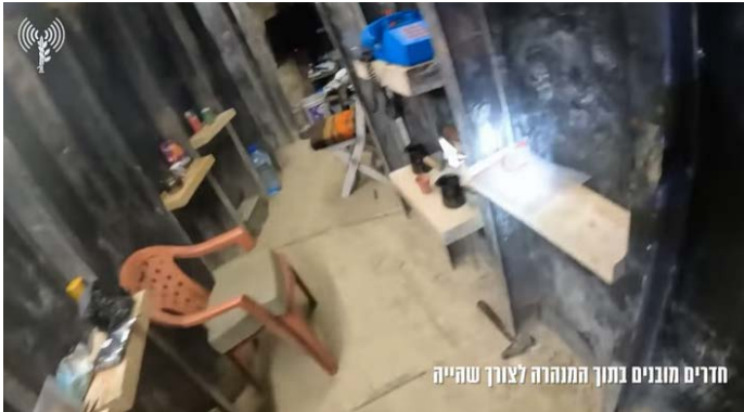
חדרים מובנים בתוך המנהרה לצורך שהייה

(אמל"ח) ובהם מטענים ומשגרים מוכנים לירי לעבר שטח ישראל שהוסתרו באתרים אזרחיים בכפרים בדרום לבנון. עשרה לוחמי צה"ל נהרגו מתחילת התמרון (דובר צה"ל, 30 בספטמבר-1 באוקטובר 2024). ◀ ב-1 באוקטובר 2024, חשף דובר צה"ל כי מאז תחילת הלחימה ב-8 באוקטובר 2023, ביצעו כוחות צה"ל מבצעים ממוקדים בדרום לבנון, במסגרתם נחשפו תשתיות תת-קרקעיות ואמל"ח של חזבאללה שנועדו לשמש את חזבאללה ליישום התוכנית לכיבוש הגליל (דובר צה"ל, 1 באוקטובר 2024).