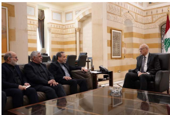
מיקאתי עם שר החוץ האיראני (סוכנות הידיעות הלבנונית, 4 באוקטובר 2024)

◀ ראש ממשלת המעבר של לבנון, נג'יב מיקאתי, נועד עם שר החוץ האיראני, עבאס עראקש'י, שהגיע לביקור בבירות. נמסר כי עראקש'י הדגיש כי איראן נחושה להמשיך לתמוך בלבנון וב"התנגדות הלבנונית" וכי היא תפתח ב"קמפיין דיפלומטי" כדי לתמוך בלבנון (ערוץ הטלגרם של משרד החוץ האיראני, סוכנות הידיעות הלבנונית, 4 באוקטובר 2024). דווח כי הפגישה בין השניים "הייתה סוערת". לפי הדיווח, מיקאתי התעקש להפריד את לבנון משאר הזירות ולא לקשר אותה לאף חזית, ואילו עראקש'י הדגיש כי "ההתנגדות היא חזית אחת" (הנא לבנאן, 5 באוקטובר 2024). בתגובה, טענה לשכת ההסברה של מיקאתי כי אין אמת בדיווח, וכי הפגישה "התקיימה בהתאם לעקרונות הדיפלומטיים" (אלנשרה, 5 באוקטובר 2024).