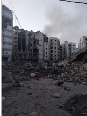
זירת התקיפה בבירות (ערוץ הטלגרם של המרכז הפלסטיני לתקשורת, 4 באוקטובר 2024)

חסן נצראללה, שנהרג בתקיפה ישראלית, ב-27 בספטמבר 2024 (סקיי ניוז בערבית ותקשורת ישראלית, 4 באוקטובר 2024).