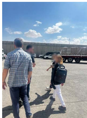
הצעירה היזידית בעת שחרורה (דובר צה"ל, 3 באוקטובר 2024)

משרד התקשורת הממשלתי של חמאס ברצועת עזה טען כי האישה היזידית התחתנה עם פלסטיני בזמן מלחמת האזרחים בסוריה ובחרה מרצונה לעבור לרצועת עזה לאחר מותו. עוד נטען כי שלטון חמאס ברצועה העניק לה הגנה לאחר שבעלה השני נהרג בתקיפה ישראלית והיא הועברה "לאזור בטוח תחת פיקוח ממשלתי". בהודעה נטען כי הצעירה ביקשה לעזוב את רצועת עזה לאחר שהרגישה לא בטוחה לאור ההפגזות הישראליות, והועברה לירדן בתיאום עם הרשויות הירדניות (משרד התקשורת הממשלתי של חמאס, 5 באוקטובר 2024).