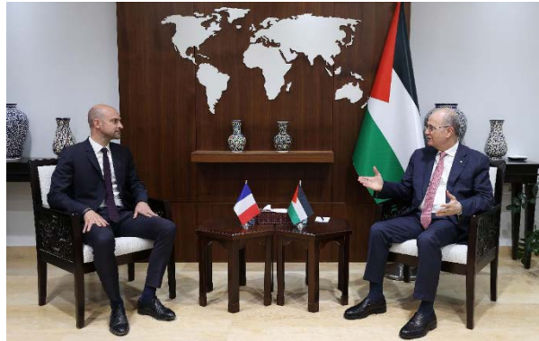
מצטפא ובארו (ופא, 7 באוקטובר 2024)

ראש ממשלת הרשות הפלסטינית, מחמד מצטפא, נועד עם שר החוץ הצרפתי, ז'אן-נואל בארו. השניים דנו במאמצים להפסקת המלחמה ברצועת עזה וב"תוקפנות" הישראלית ביהודה ושומרון ובמזרח ירושלים. מצטפא הדגיש את מחויבות ממשלת הרשות הפלסטינית לרצועת עזה ולהבטחת יציבות כלכלית למרות "המצור וההגבלות הישראליות". כמו כן, הוא שיבח את דברי נשיא צרפת, עמנואל מקרון, על הצורך להפסיק את ייצוא הנשק לישראל (ופא, 7 באוקטובר 2024).