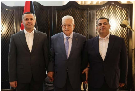
אבו מאזן ובניו של הניה (סוכנות סוא, 2 באוקטובר 2024)

במהלך הביקור בדוחה, נפגש אבו מאזן עם בניו של איסמעיל הניה, ראש הלשכה המדינית לשעבר של חמאס שנהרג ב-31 באוגוסט 2024. במהלך המפגש, הביע אבו מאזן את תנחומיו בפני המשפחה והזכיר את "תרומתו" של הניה למאבק הלאומי הפלסטיני, אבו מאזן ציין כי העם הפלסטיני ימשיך לשאוף להשגת זכויותיו הלגיטימיות לחירות ולעצמאות, חרף "פשעי הכיבוש הישראלי", והדגיש את אחדות העם הפלסטיני במאבקו להקמת מדינה עצמאית שבירתה מזרח ירושלים (ופא, 2 באוקטובר 2024).