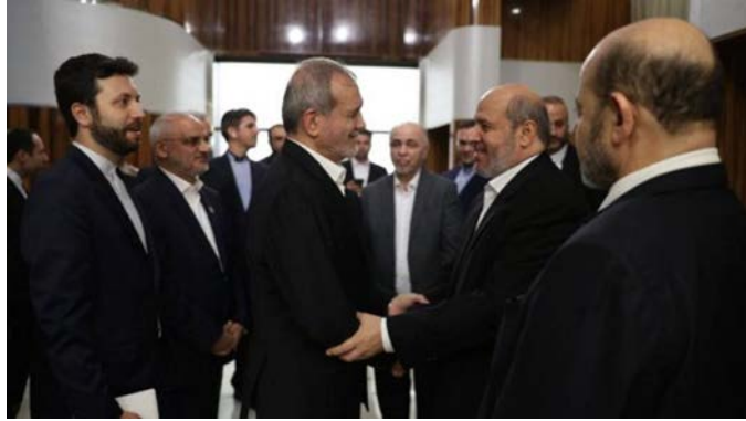
פגישת נשיא איראן ובכירי חמאס (מימין: אירן"א, 3 באוקטובר 2024)

תנועת חמאס שיבחה את מתקפת הטילים שביצעה איראן נגד ישראל. בהודעה מטעם התנועה נמסר כי זו תגובה ל"תוקפנות הציונית" נגד העם הפלסטיני והלבנוני ומסר חזק ל"אויב הציוני" במטרה להרתיעו "משום שפשעיו עברו כל גבול". כמו כן, קראה חמאס לכלל המדינות, העמים והמפלגות של האומה הערבית להתעמת עם "הפשעים הציוניים" (ערוץ הטלגרם של חמאס, 1 באוקטובר 2024).