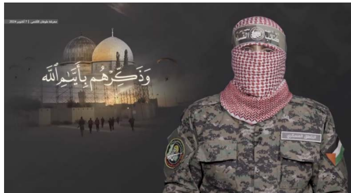
אבו עבידה בנאום לציון שנה ל-7 באוקטובר (ערוץ הטלגרם של אבו עבידה, 7 באוקטובר 2024)

החטופים ואיים שיהיו עוד "עשרות מקרים חדשים של רון ארד" (ערוץ הטלגרם של אבו עבידה, 7 באוקטובר 2024).