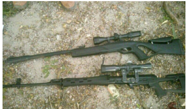
חלק מאמצעי הלחימה שאותרו בכפרים בדרום לבנון: רובי צלפים, טילי נ"ט (מונחי תיל מסוג Fagot) 2 ורקטות קטיושה (דובר צה"ל, 12 באוקטובר 2024)

◀ צה"ל תקף בדרום לבנון תשתיות של היחידות המרחביות של חזבאללה, מטרות של כוח אלרצ'ואן, מטה המודיעין ומערך הרקטות לטווח בינוני (דובר צה"ל, 10-12 באוקטובר 2024):