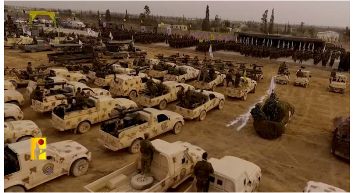
פעילים של כוח אלרצ'ואן, יחידת העילית של חזבאללה, במהלך מפגן צבאי (ערוץ הטלגרם של זרוע ההסברה הקרבית של חזבאללה, 7 באוקטובר 2024)