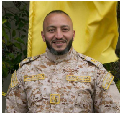
חסין מחמד עסילי