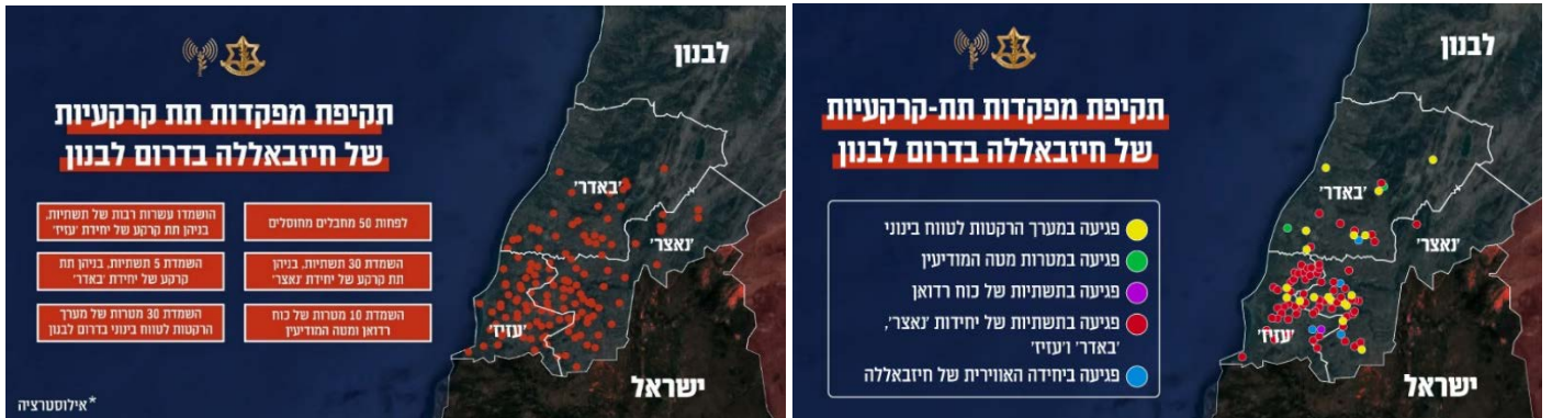
מפות של תקיפות צה"ל נגד מפקדות תת-קרקעיות של חזבאללה בדרום לבנון (דובר צה"ל, 8 באוקטובר 2024)

◆ במערך הרקטות לטווח בינוני הותקפו 30 מטרות.