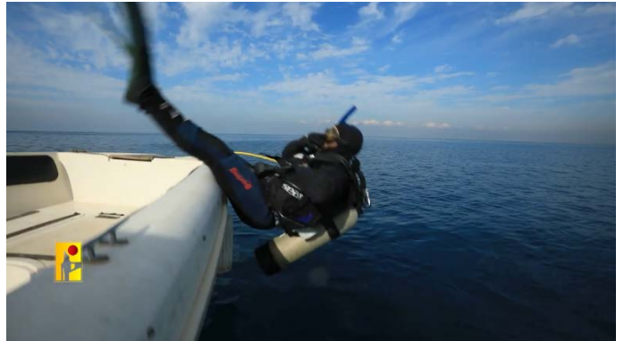
אנשי הקומנדו הימי של כוח אלרצ'ואן (ערוץ הטלגרם של זרוע ההסברה הקרבית של חזבאללה, 7 באוקטובר 2024)