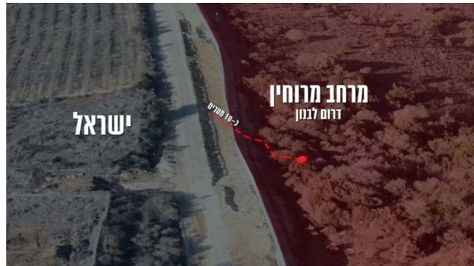
המנהרה החוצה מלבנון לשטח ישראל (דובר צה"ל, 8 באוקטובר 2024)

הישראלי ולא הגיעה ליישוב בשטח ישראל. עם איתור המנהרה לפני מספר חודשים, היא מולכדה ולאחרונה נוטרלה (דובר צה"ל, 8 באוקטובר 2024).