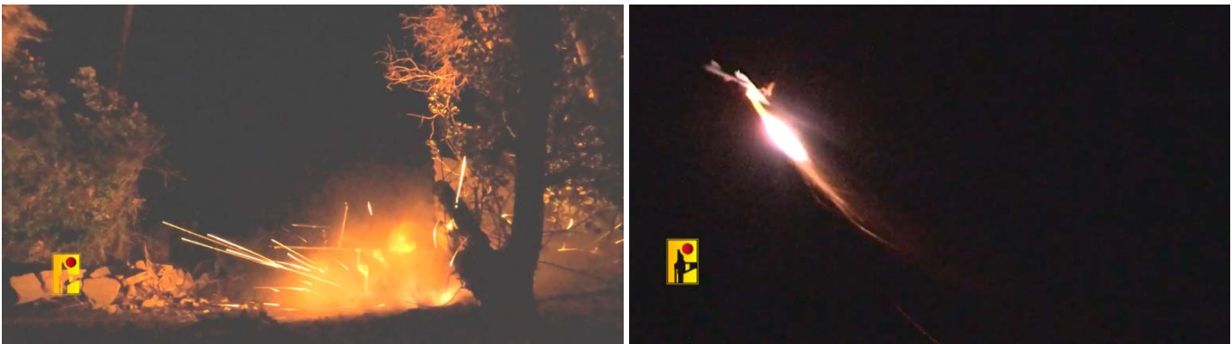
שיגור שניים מכטב"מי הנפץ לעבר תל אביב ב-11 באוקטובר 2024 (ערוץ הטלגרם של זרוע ההסברה הקרבית של חזבאללה, 13 באוקטובר 2024)

♦ שיגור כטב"מים לעבר אזור תל אביב: חזבאללה הודיע, כי שיגר ב-11 באוקטובר 2024 נחיל כטב"מי נפץ לעבר פאתי תל אביב "כאות תמיכה בעם הפלסטיני ובהתנגדותו האמיצה והמכובדת, וכהגנה על לבנון ועל העם הלבנוני, ובתגובה על ההפרות הברבריות של ישראל נגד ערים, כפרים ואזרחים". בהקשר לכך, דווח כי זוהו שני כלי טיס בלתי מאוישים שחצו משטח לבנון. כלי הטיס היו במעקב מרגע חציית הגבול מלבנון. כלי טיס אחד יורט. צוין, כי ישנה פגיעה בבניין בהרצליה (דובר צה"ל, 11 באוקטובר 2024). על-פי סרטון, שפרסם חזבאללה, מדובר בשיגורים של לפחות שלושה כטב"מים (ערוץ הטלגרם של זרוע ההסברה הקרבית של חזבאללה, 13 באוקטובר 2024).