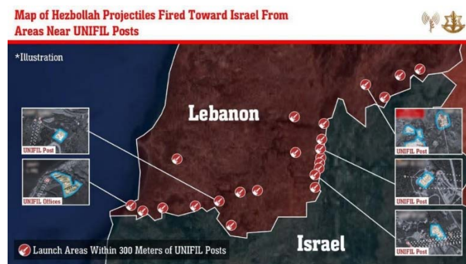
מפת שיגורים של חזבאללה מאזורים בקרבת מוצבים של יוניפי"ל לעבר ישראל (דובר צה"ל, 13 באוקטובר 2024)

◀ דובר צה"ל הצהיר כי בחודש האחרון שוגרו 25 רקטות וטילים על-ידי חזבאללה מאזורים הסמוכים לכוחות יוניפי"ל.